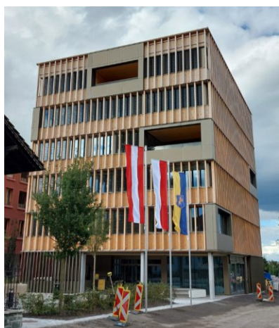
Das neu errichtete Rathaus in Hohenems kann man bald besichtigen.

HOHENEMS Das neue Rathaus in Hohenems öffnet im Rahmen des Emser Markts am Samstag, 27. September, von 11 bis 14 Uhr seine Türen für Besucher. Dabei können alle Bürgerinnen und Bürger auch Stockwerke besichtigen, die sonst nicht öffentlich zugänglich sind. Das moderne Gebäude vereint nahezu alle städtischen Abteilungen unter einem Dach. Die Besucher erhalten Einblicke in Architektur, Raumkonzept und Arbeitswelt der Stadtverwaltung.